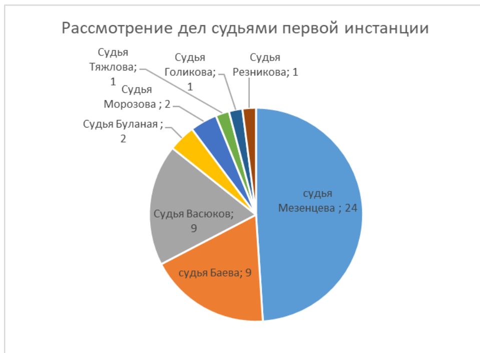
Рис. 3. Количество дел, рассматриваемых судьями в первой инстанции