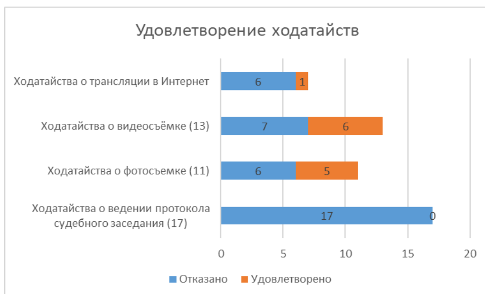
Рис. 5 Разрешение судом ходатайств (стороны защиты)

ходатайства с трудно понимаемой целью и/или обоснованием.