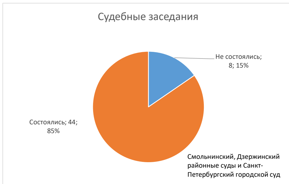
Рис. 1. Распределение дел в суде по первой инстанции

Мониторинг проходил в трех судах – Смольнинском и Дзержинском районных судах по делам в первой инстанции и в Санкт-Петербургском городском суде по делам в апелляции. В первой инстанции большинство судебных заседаний (около 73%) рассматривались в Смольнинском суде, 21% – в Дзержинском.